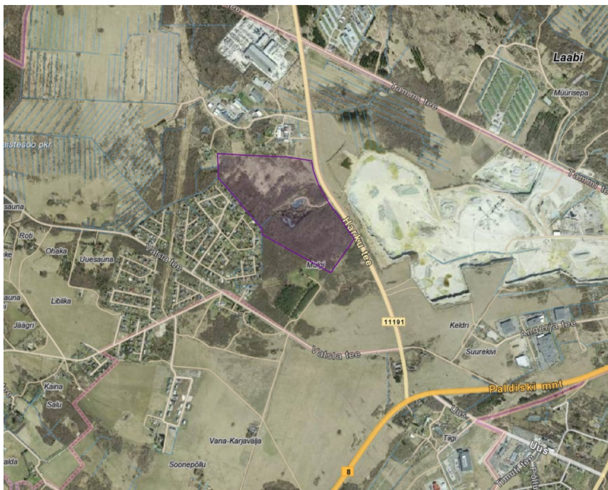
Joonis. Harku VII lujakivikarjääri asukoht.

KMH viiakse läbi keskkonnaloa (tegevusloa) andmise üle otsuse tegemiseks, sh loatingimuste määramiseks. KMH käigus hinnatakse kavandatava tegevuse ja selle alternatiivide mõju keskkonnale, tuuakse välja selle olulisus ning võimalikud leevendusmeetmed negatiivse mõju vähendamiseks või vältimiseks. Keskkonnamõju hindab KMH juhtekspert ja eksperdirühm koos arendajaga.